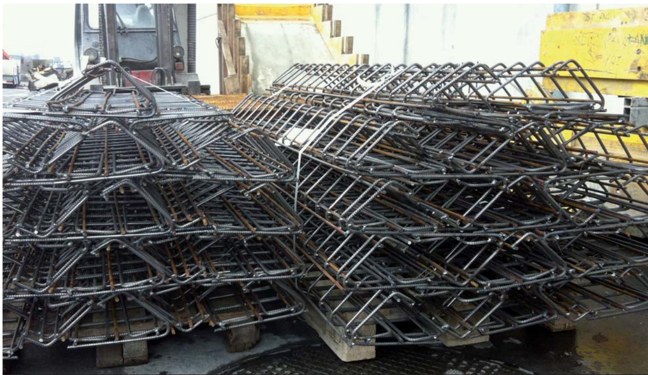
Die Bravera GmbH stellt auch Bewehrungen für Konstruktionen in der Vorfabrikation her. Hier geschweisste Spezialarmierung für ein Fertigteilwerk.